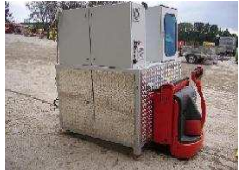
Computer gesteuerte Schneideanlage