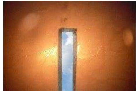
Detail-Innenansicht neugefräste Schlitzrinne

Durch die Kombination des r.tec ® Schlauchlining verfahrens auf Basis von Epoxydharzen und der Schlitzrinnen-Schneideanlage kann eine extrem rasche Projektdurchführung und ein weitgehend störungsfreier Betrieb der Anlage (zB Flugfeld, Parkplatz, Tunnel, Autobahn) bei Reduktion der Instandhaltungskosten im Vergleich zu herkömmlicher Rohrauswechslung oder –sanierung für den Betreiber erreicht werden.