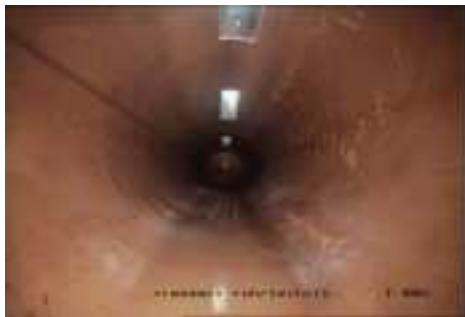
Innenaufnahme saniertes Rohr