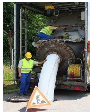
Reversion des r.tec Schlauchliner in das Altrohr

Das Sanierungskonzept basiert auf der Verwendung des auf Epoxydharz basierenden r.tec® Schlauchlining Verfahrens, da die Verwendung dieses Harzes einen formschlüssigen Verbund gewährleistet, wodurch eine Hinterwanderung des Liners mit Wasser vermieden wird. Im Rahmen des Verfahrens wird ein mit Epoxydharz imprägnierter, flexibler Schlauch in das zu sanierende Rohr mit Druckluft unter Nutzung vorhandener Schächte eingebracht. Durch das nachfolgende Einleiten von Heißdampf wird eine kontrollierte Aushärtung des Harzes bewirkt, wobei der bereits oben erwähnte formschlüssige Verbund mit dem Altrohr entsteht. Gleichzeitig werden Fugen und Risse im Altrohr durch das überschüssige Epoxydharz zusätzlich geschlossen. Aufgrund der Flexibilität des Schlauchliners können Installationslängen bis zu 250 Meter in einem Schritt problemlos durchgeführt werden, auch bei Bögen im Rohrverlauf ist eine Sanierung mit dem r.tec® Schlauchlining Verfahren in der Regel möglich. Das Verfahren ist auch auf Eignung für den Einsatz bei Freispiegelleitungen nach DIN EN 13566-4 geprüft und zugelassen.