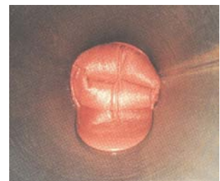
Innenansicht harzgetränkter Liner bei der Reversion